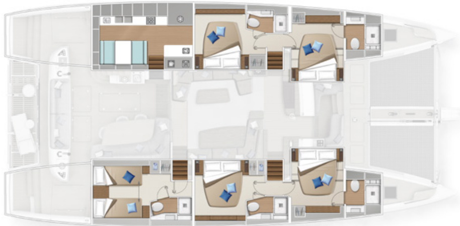
Version cuisine latérale - 5 cabines Lateral galley version - 5 cabins