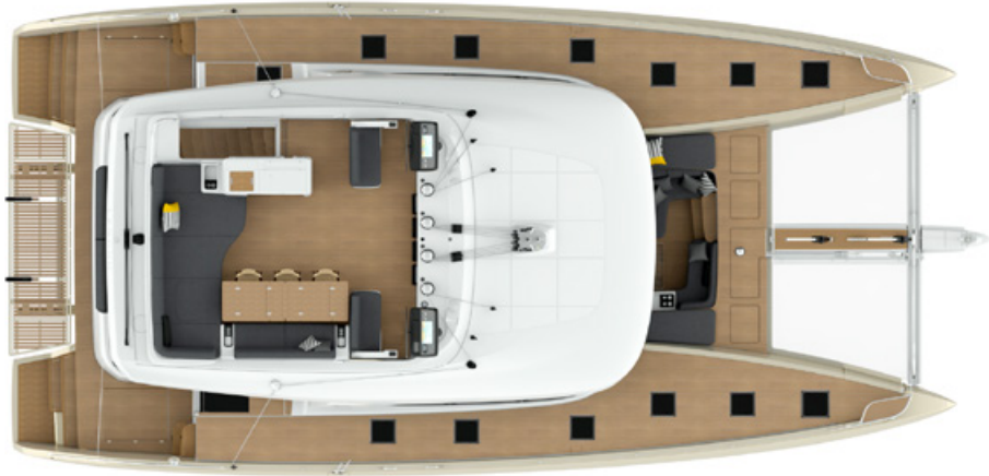
Bain de soleil Sunlounger pads