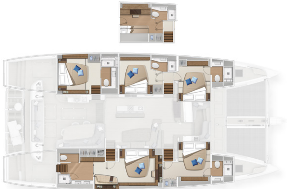
Version cuisine centrale - 5 cabines Central galley version - 5 cabins