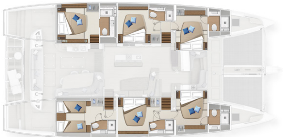
Version cuisine centrale - 6 cabines Central galley version - 6 cabins