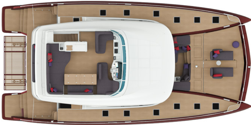
Bain de soleil Sunlounger pads