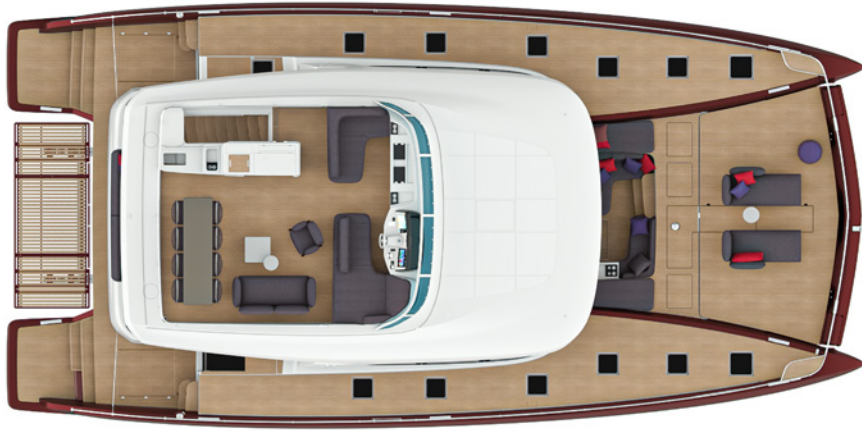
Loose furnitures by Tribù Loose furnitures by Tribù