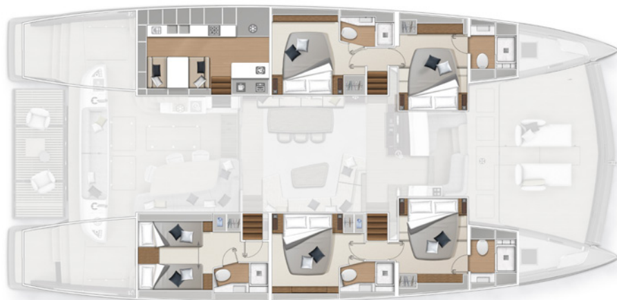
Version cuisine latérale - 5 cabines Lateral galley version - 5 cabins