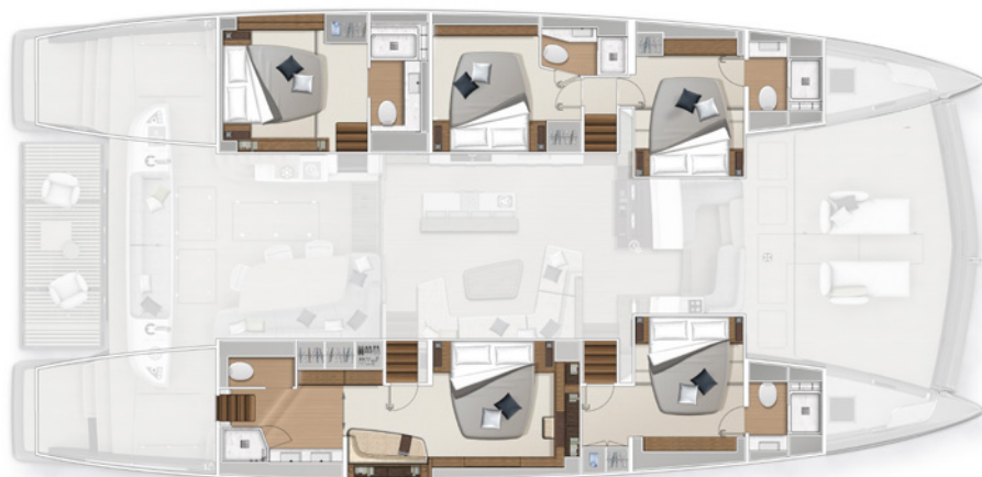
Version cuisine centrale - 5 cabines Central galley version - 5 cabins